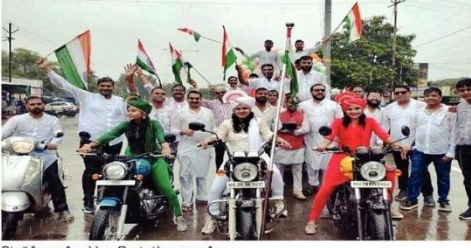
तिरंगा रॅलीत सहभागी असलेल्या विद्यार्थ्यांच्या संख्येचे सद्यतन व पुढील.

खामगाव - विद्यार्थ्यांच्या अग्रेसरता असलेल्या शाळा, महाविद्यालयांसह सामाजिक संस्थांनी तिरंगा रॅली घेण्यात आली. यामध्ये विद्यार्थ्यांच्या अग्रेसरता असलेल्या शाळा, महाविद्यालयांसह सामाजिक संस्थांनी तिरंगा रॅली घेण्यात आली. यामध्ये विद्यार्थ्यांच्या अग्रेसरता असलेल्या शाळा, महाविद्यालयांसह सामाजिक संस्थांनी तिरंगा रॅली घेण्यात आली.